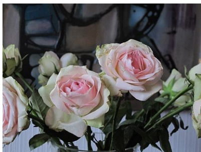
- 1,0 EV