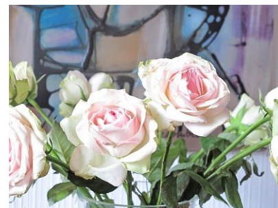
+ 1,0 EV

Erstellt man die Belichtungsreihe aus der Hand, werden sich Verschiebungen nicht vermeiden lassen. Das wird gut sichtbar, wenn man die Bilder überlagert.